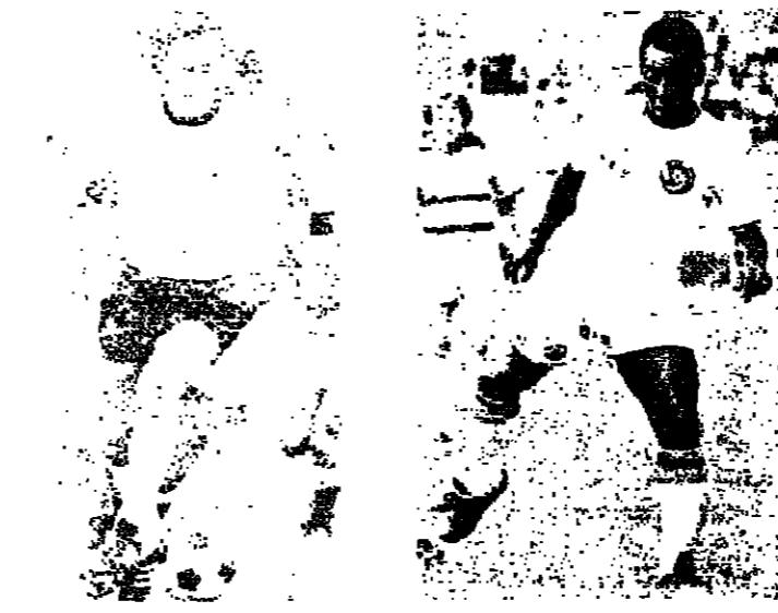
بيليه برك سانتوس والبرازيل ولكنه لم يتخل عن رغبته الشهيرة

ولد تقريبا ورامته اليوس سنوات ثم هبطت التهمة فجاءه على بيليه عن طريق تيمه المسية . وإذا كان المرء فان ذلك يعني ان الجوهرة السوداء حريصا بدافع من حبه للملح الذي انتقده في السابق . وانطلاقا من هذا الواقع - نسان الاسئلة التي طرحت على بيليه تناولت هذه الناحية ايضا قائلا كان رده عليها ؟ بيليه ، قلت انك عدت عن قرار الاعتزال من اجل المال ، فهل انت بحاجة الى المال رغم كل تركك ؟ اذا كنت تصمد اني بحاجة لمسة المال ، فبالطبع لا ، وعلى كل حال ، اني لا اعيش حالة تدهور ولا استخف بما يقوله الآخرون ، لقد كتبت من المال ما يؤمن الجيش الريفي المعتلى